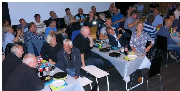
God stemning på Truckers Night på Rudshøgda.