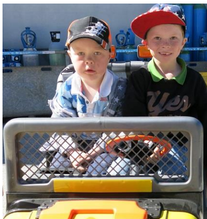
Sæterholen-gutta bak rattet.