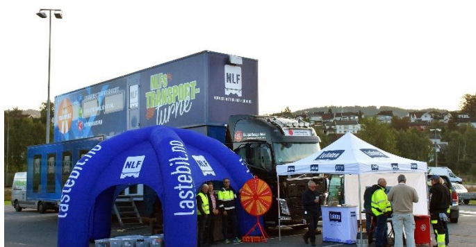
Frokost ved Circle K på Strandtorget var populært.

NLFs adm.dir. Geir Mo sier at valget er over – det er nå det gjelder! Gjennom NLFs Transportturné i forkant av valget har vi fått overraskende mange forpliktelser fra samtlige politiske hold.