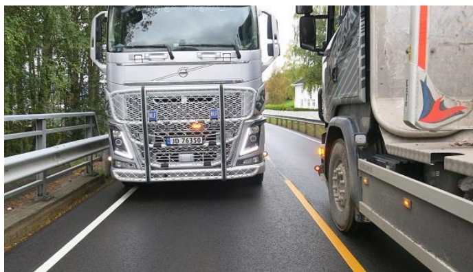
Da FV34 fikk gul midtstripe ble det flere utfordringer for yrkessjåførene. NLF var med på befarings med vegvesenet.