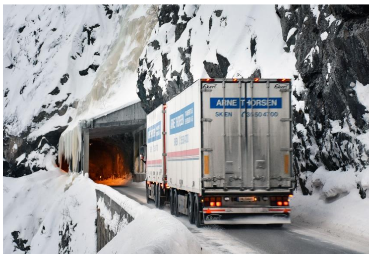
E16 i Valdres må utbedres! Valdres Lastebileierforening, regionen og NLF sentralt kjemper for at blant annet Kvamskleiva skal få 8,5 meters vegbredde.