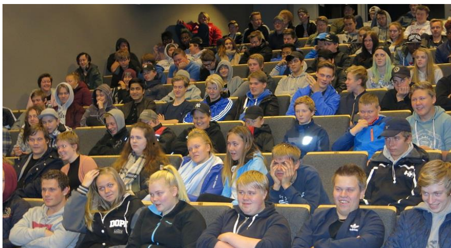
Fullt hus på TAKO-senteret under høstens lærlingedag!

Samboerskap med opplæringskontorene har ført til mer fokus på sjåfør-rekruttering. I 2017 gjennomførte vi en vellykket lærlingedag i vårt nye senter på Rudshøgda. Det var et fint opplegg med simulatorer, truckkjøring og store lastebiler samt gode innlegg fra talerstolen. 130 ungdommer brukte en skoledag på TAKO-senteret.