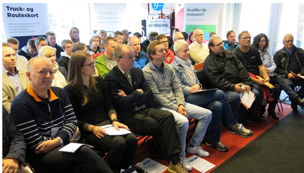
Fullt hus da traileren stoppet på Rudshøgda. Fair Transport fenet!