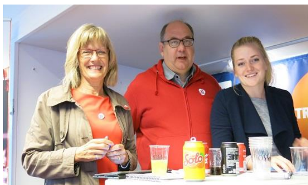
Debattemte i Elverum: SVs Karin Andersen, Aps Per Gunnar Sveen og Sps Emilie Enger Mehl er klare.