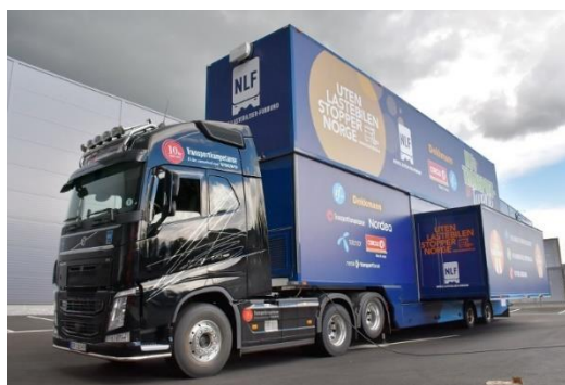
NLFs transportturne ble en suksess. Traileren kjørte hele 7200 km for lastebileierforbundet!